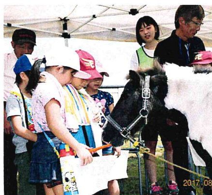
昨年の「せせらぎまつり」の様子