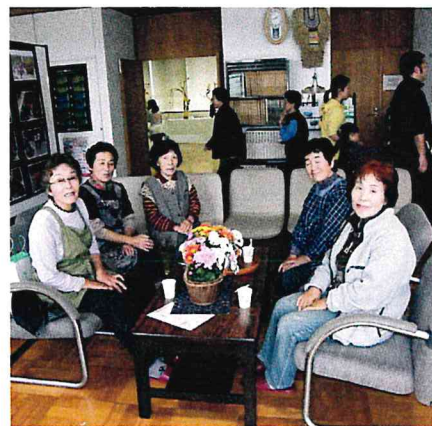
コミセン談話ホールを一新!