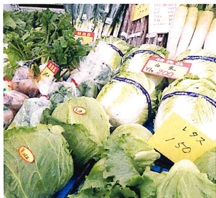
家庭菜園の農作物の販売も！