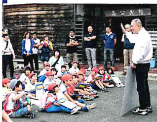
森公民館スタート