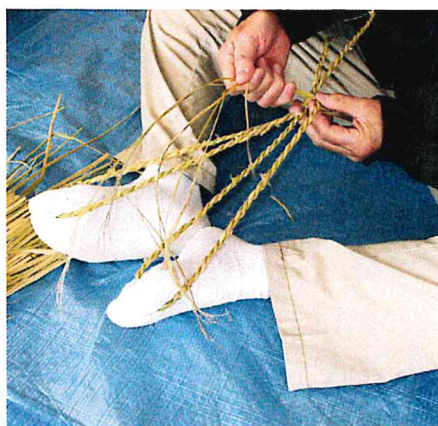
自前の「わらじ」を履いて獅子舞も!