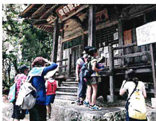
数々の問題を解きながら歩きました！