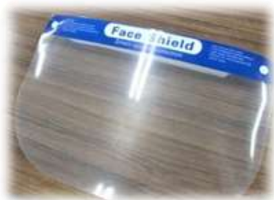
フェイスシールド（教員分）