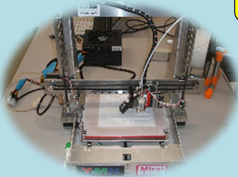
2018 北信越,東北大会出場ロボット