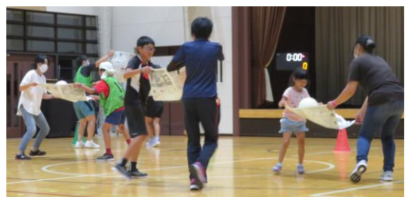
親子での風船リレー

「育もう親子の絆 広げよう平野の和」これはPTA 母親委員会の活動スローガンです。今回のPTA 母親委員会のみなさんが企画運営してくださった親子レクリエーションにたくさんの方が参加してくださいました。おたまりレー、風船リレー、雑巾がけリレーを通して、「絆」が生まれ、「和」がひろがりました。