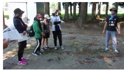
5年のけん玉ペインティング【左】 6年の散居地域探検【右】