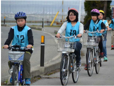
乗り方を一つ一つ確認して 安全に楽しく。