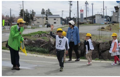
横断するときの約束を忘れないで。