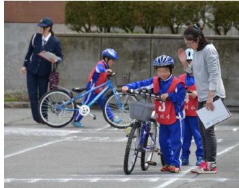
模擬道路での練習が後々 役に立ちます。