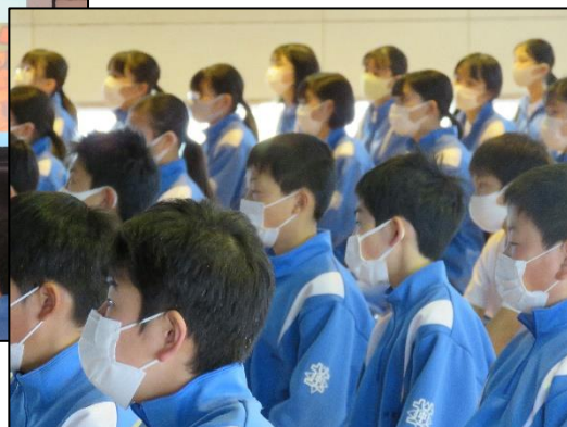
下:1年生の真剣な眼差し