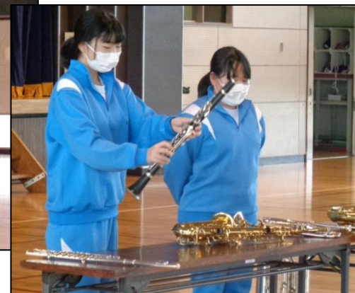
下:感染予防のため楽器の紹介