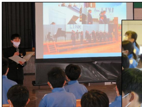
上:生徒会活動説明のようす