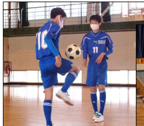
上:実演する上級生の姿