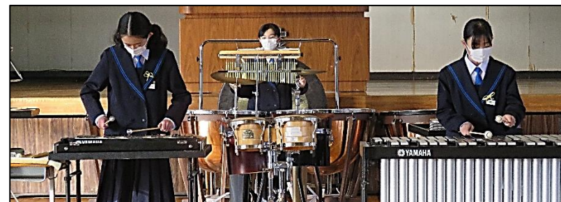
左 下 打楽器三重奏 金管八重奏

12月14日(火)の全校朝会で、アンサンブルコンテストの壮行演奏が開催された。朝から、爽やかで心地よい音色に体育館の空気が和んだ。