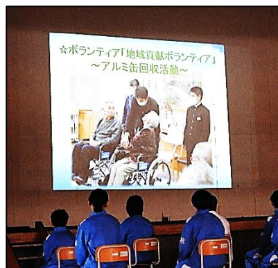
上:生徒会活動説明のようす