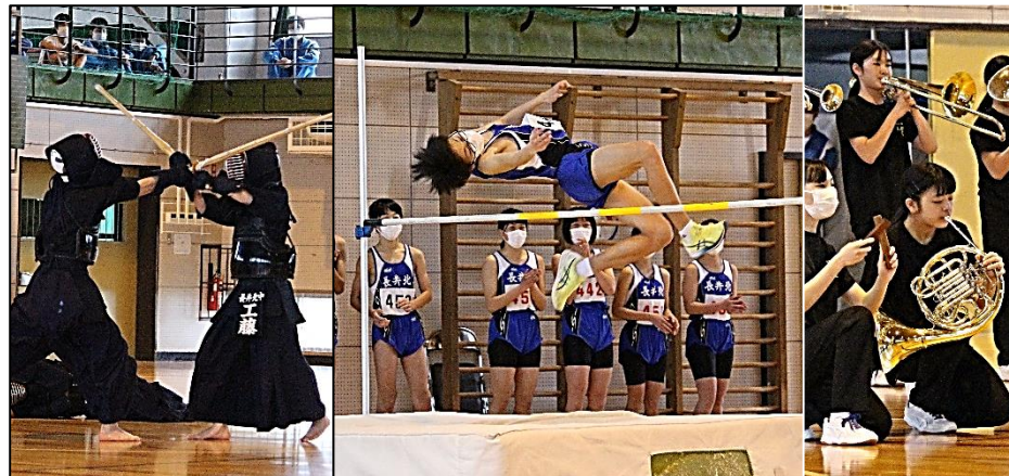
実演する上級生の姿