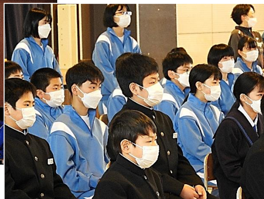
下:1年生の真剣な眼差し