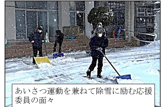
あいさつ運動を兼ねて除雪に励む応援委員の面々

トラスリボン運動」を展開して2年が経ちます。この運動のおかげで、本校では誹謗中傷などで相手を傷つけるようなことは一切ありませんでした。誇らしい伝統の一つです。このトラスリボン運動の精神を生かし、生活全般において人をけなしたり、悲しませたり、不安にさせるようなことはありませんでしたか。