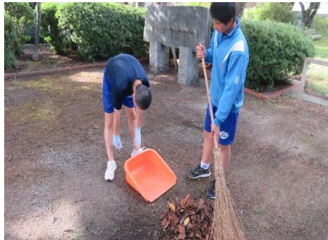
【野球部】長井中跡地