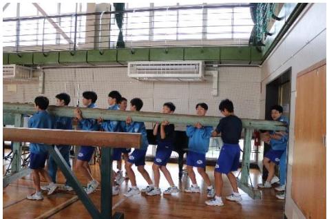
【男子バスケット部】 北中体育館用具庫