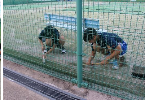
【男子・女子ソフトテニス部】市営テニスコート