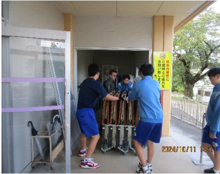
【男子・女子バレーボール部】西根小学校体育館等

10月11日(金)午後、全校ボランティアを行いました。毎年、創立記念日に行っている伝統の行事です。「お世話になっている地域や学校に対し貢献的な活動を行い、奉仕の心を養うこと」、「北中伝統の『北風活動』」の一つである『ボランティア』に対する意識を高め、実践する力をつけること」がねらいです。部ごとに分かれて、清掃や整理などの奉仕活動を行いました。部に所属していない生徒は、自分の学級の清掃とワックスかけを行いました。一般的に、ボランティアには4つの原則があるとされています。①自ら進んで行動する ②ともに支え合い、学び合う ③見返りを求めない ④よりよい社会つくる です。一人一人、そんな精神で活動ができたでしょうか。