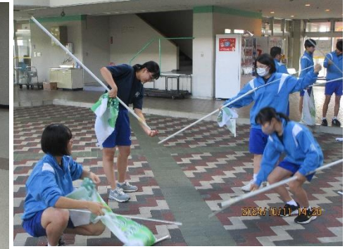
【男子・女子卓球部】生涯学習プラザ