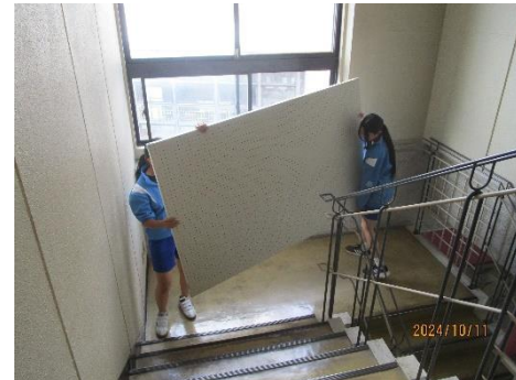
【ソフトボール部】ふらり