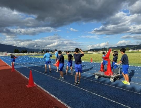
【陸上部】アスリートフィールド