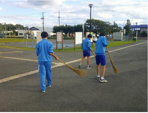
【サッカー部】アスリートフィールド