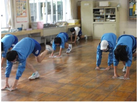
【総合文化部】北中美術室・被服室