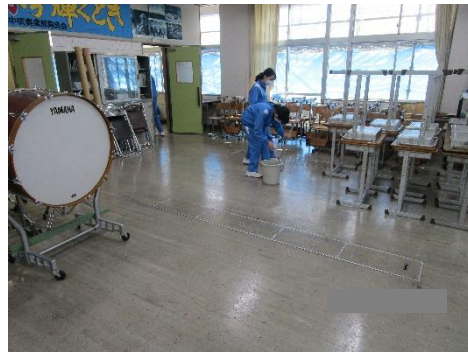
【吹奏楽部】北中音楽室等