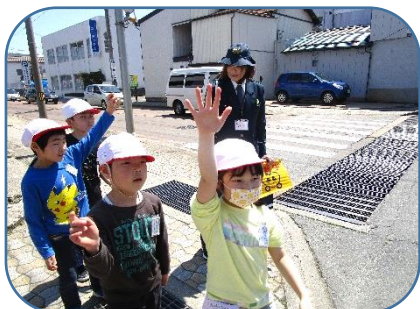
2年生は、横断歩道の渡り方を勉強しました

学校では、子ども達の安全を守ること、そして、自分の身を守る判断力を育てることを大事にしています。4月10日の6年生を皮切りに、全ての学年で交通安全教室を実施しています（3年生は5月16日に実施予定）。1、2年生は、道路の歩き方や信号のわたり方を勉強し、3年生以上は自転車の乗り方の勉強をしました。なお、3年生以上の交通安全教室においては、多数の保護者の皆様にご協力をいただいておりますことに感謝申し上げます。また、4月12日には、消防署の指導の下、火災を想定した避難訓練を実施しました。子ども達は整然と速やかに避難することができました。今年も避難訓練を計画的に実施し、安全意識や判断力を育てていきます。ご家庭でも、安全な登下校や自転車の乗り方、そして、火の使い方についてぜひお話ししてください。