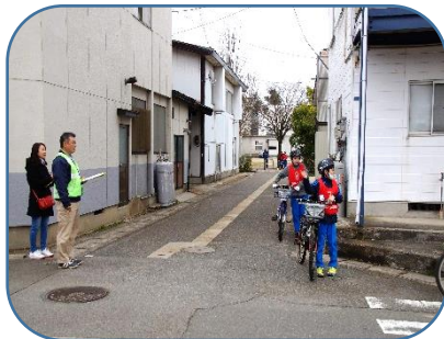
6年生には、自転車の乗り方でも下級生の手本となってほしいと思います