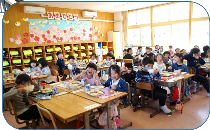
そして、もりもり食べています