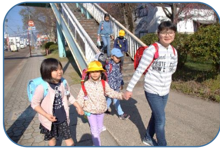
上級生が1年生の手を引きながら元気に登校しています。ほほえましい光景です。

入学式・始業式から約2週間が経ちました。どの学年の子ども達も元気に登校し、学校生活をスタートしました。1年生は、黄色い帽子と黄色いカバーのランドセルを背負い、上級生のお兄さん、お姉さんに手を引かれながらがんばって歩いて登校しています。給食の準備も大変上手でもりもりと残さず食べています。6年生は、朝のボランティア活動として、朝の清掃活動やあいさつ運動など学校のリーダーにふさわしい活動ぶりです。どの学年も授業や清掃に一生懸命に取り組み、一人一人のやる気を感じる1年の始まりです。