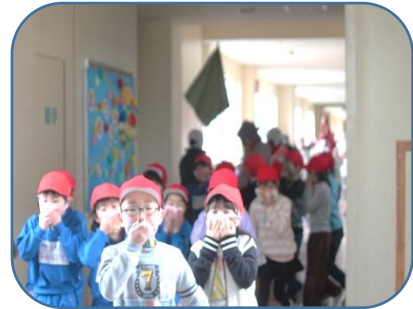
口にハンカチをあて、煙を吸わないように速やかに避難しました