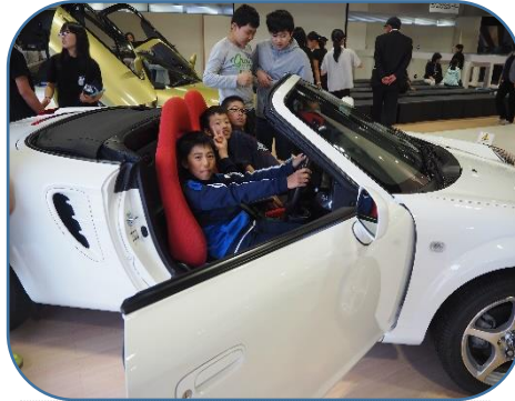
トヨタ自動車では、最新の設備やロボットによる生産の様子を見学しました

長井市ではなかなか体験できない工場や被災地の見学、さらには、班別自主研修やホテルでの集団生活を通して、多くのことを知り、仲間への思いやりや協力することの大切さを学んだ修学旅行となりました。