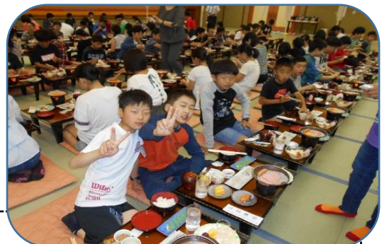
ホテルでの生活は、貴重な体験となりました