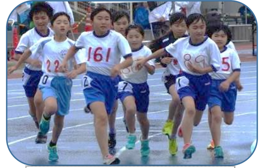
雨が降る悪コンディションのなかでも、最後まで全力で走りました

県大会の出場権を獲得した6名には、7/6の混合リレーの部、7/15の県小学生陸上大会において、本校代表のみならず、西置賜地区代表として精一杯のがんばりを期待します。