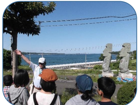
南三陸町では語り部の方からお話をお聞きしました