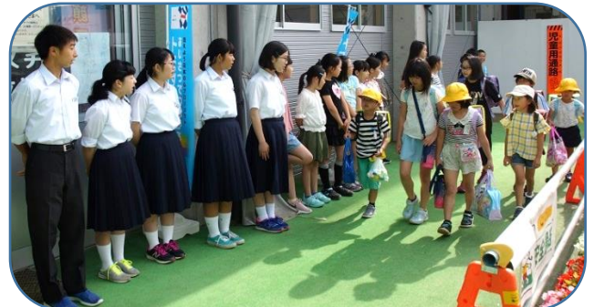
5年3組の児童と一緒にあいさつ運動を行ってくれました

長井北中生徒会が、『北風（ほくふう）活動』の一つとして力を入れている「さわやかなあいさつ」を母校の小学校でも行ってくれました。中学生に笑顔であいさつを返す小学生もたいへん多く、ほほえましく感じられました。