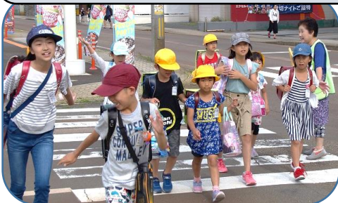
慈愛っ子まもり隊の皆様には、登下校の安全確保に努めていただいております(市役所前十字路において)

慈愛っ子まもり隊の皆様には、児童の登下校の安全確保にご尽力いただいております。現在、慈愛っ子まもり隊には、28名の皆様に登録をしていただいております。6月27日に出発式を行いました。