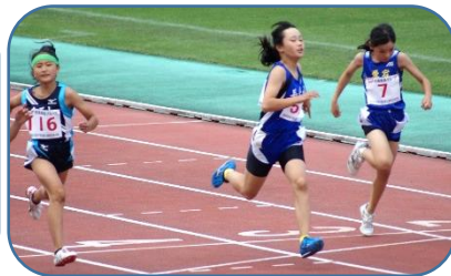
女子5年100mで3位に入賞しました（左から2人目）