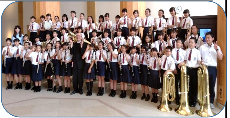
全員が心を合わせ演奏し、素敵な笑顔にあふれていました

本校は、参加した4つの小学校の2番目に登場。『バンドの為に民話』を演奏し、審査員の先生からは「バンドのまとまり一体感が伝わる演奏でした。サウンドも柔らかな響きが心地よかったです。」という講評をいただきました。ぜひ、県大会でも予選会以上の素晴らしい演奏をしてくれることを期待しています。