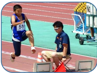
男子コンバインドB（走幅跳、ジャベリック）で7位に入賞しました