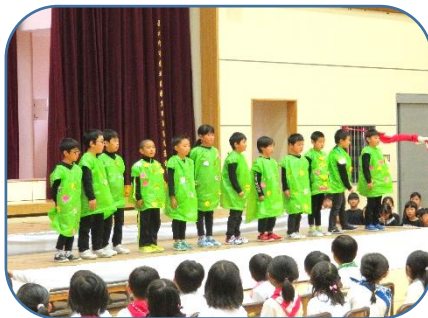
2年：群読「じゅげむ～ひとりひとり大切な なまみんなちがってみんないり～」