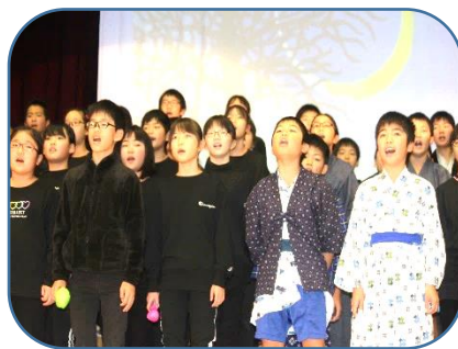
5年：群読「きっとやるぞ！こぼとっ子！！ ～覚悟を決めた豆太の『勇気』『優しさ』を伝 えよう～」