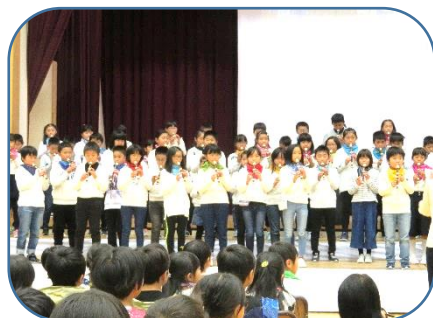
4年：音楽「歌でつなぐ心と心 かがやけ にじいろハーモニー」