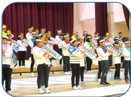
1年：音楽「みんなともだち ～ひびけ れいわのハーモニー～」

保護者の皆様には、道具や服装の準備、お子さんへ温かな励ましをいただいたことに感謝申し上げます。