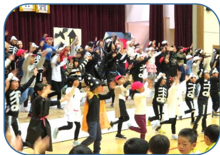
3年：劇『ヒュードロンお化け学校』 ～友だちいっぱい お化けもいっぱい みんな なかよしつくしっ子～