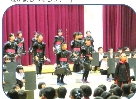
6年：劇『本当に大切なもの』～愛と感謝を 伝えよう～