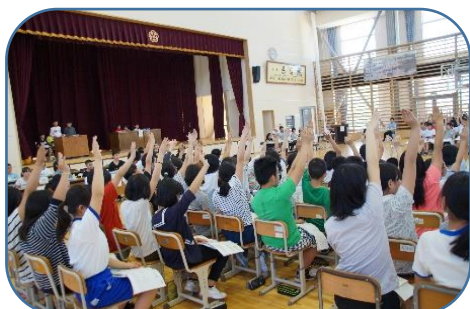
積極的に挙手をし、どの学級も、学級や自分の考えを発表できました