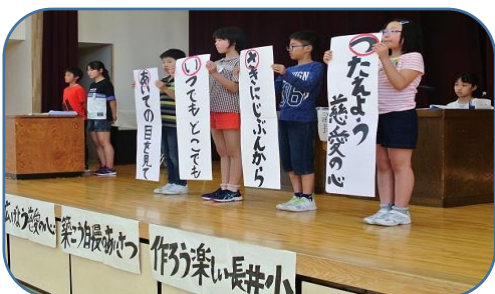
委員長は、堂々と今年度の説明と受け答えができました

校長からは、「なぜ、児童会活動があるのかを考えてほしい。いじめゼロの取り組みや本の整理整頓、石けんの補充などは、児童会で約束や取り組みを決めて、みんなが困らないようにするため、さらに、あいさつ運動やアルミ缶集めなどは、学校生活をさらに良くするためです。」と、児童会活動の目的と児童のみなさんへの励ましのお話もありました。