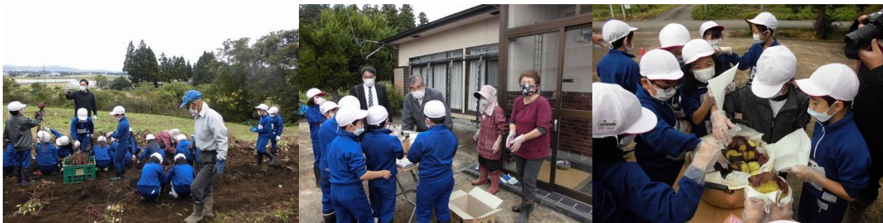
3年生が夢中になって取り組んだサツマイモ掘り

次は、10月29日(土)の学習発表会で一人一人が輝くよう、取り組んでまいります。