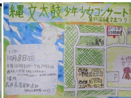
気合の入った練習の様子と作成したポスター