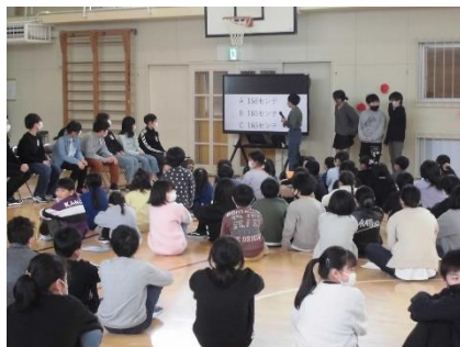
6年生を送る会で5年生のクイズ