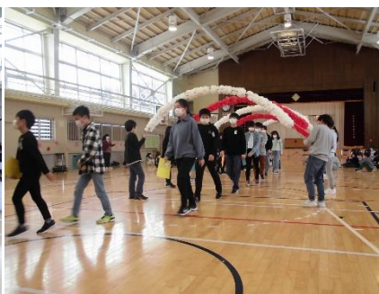
4年生のアーチをくぐって退場