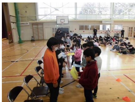
よせがきのプレゼント