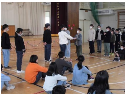
児童会引き継ぎ式

在校生は、6年生を送る会を成功させるために話し合い、合意形成し、準備を進めてきました。6年生は、感謝の気持ちと引き継ぎたいことを伝えるための課題に取り組み、準備を進めてきました。そして当日は大成功。心温まる集会に取り組み中で、子供たちの大きな成長が感じられました。