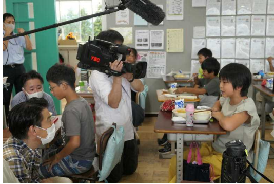
インタビューを受ける児童