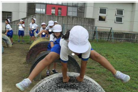
勢いよく跳ぶタイヤ跳び

入学してから半年がたち、1年生の子どもたちはかなり成長してきています。運動面では、体育の時間はもちろん、休み時間なども遊具を使って遊ぶ姿が見られ、できることがたくさん増えています。18日の体育の様子からそのいくつかを紹介します。