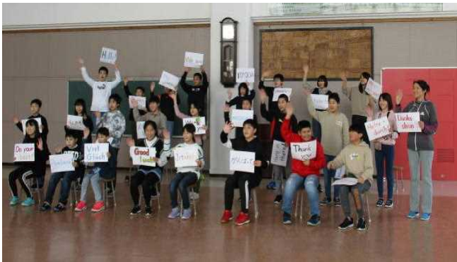
【児童会・廊下歩行の取り組み】

15日(金)におらんだラジオの方が来校し、タンザニアとリヒテンシュタイン選手団に向けた応援メッセージの収録を行いました。6年生が、日本語、スワヒリ語、ドイツ語、英語を使い、自分たちで考えたメッセージを伝えました。コロナが収まり大会ができることを願うばかりです。